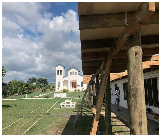
Ο ιερός Ναός της Αγίας Τριάδος κατά την κατασκευή του νέου υποστέγου. FIJI

και να το συγκρίνουμε με την μικρότερη μορφή του ανθρωπίνου είδους. Το ζυγωτό ή την ανάπτυξή του, το ανθρωπινό έμβρυο ηλικίας λίγων ωρών, ημερών, εβδομάδων. Αν ο ιός που δεν είναι τίποτε άλλο από γενετικό υλικό, έχει τη δύναμη να σκορπίσει τον θάνατο και να έχει τόση μεγάλη επίδραση στις ζωές μας, πόσο μάλλον το έμβρυο στην μήτρα της μητέρας του που είναι οργανωμένη και πολύπλοκη μορφή ζωής και εν δυνάμει άνθρωπος, αν αφεθεί να αναπτυχθεί ελεύθερα, μπορεί να σκορπίσει την ζωή. Αν ο ιός έχει δικαίωμα στο θάνατο, το ζυγωτό έχει δικαίωμα στην ζωή.