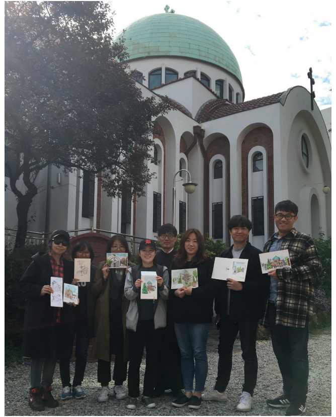
Φοιτητές και φοιτήτριες της Σχολής Καλών Τεχνών μπροστά από τον Καθεδρικό ναό του Αγίου Νικολάου με τα έργα τους