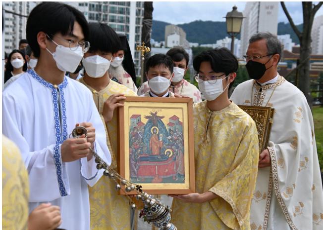
Από την Λιτανεία της εορτής της Κοιμήσεως της Θεοτόκου στην πόλη Jeonju (15.8.2022)