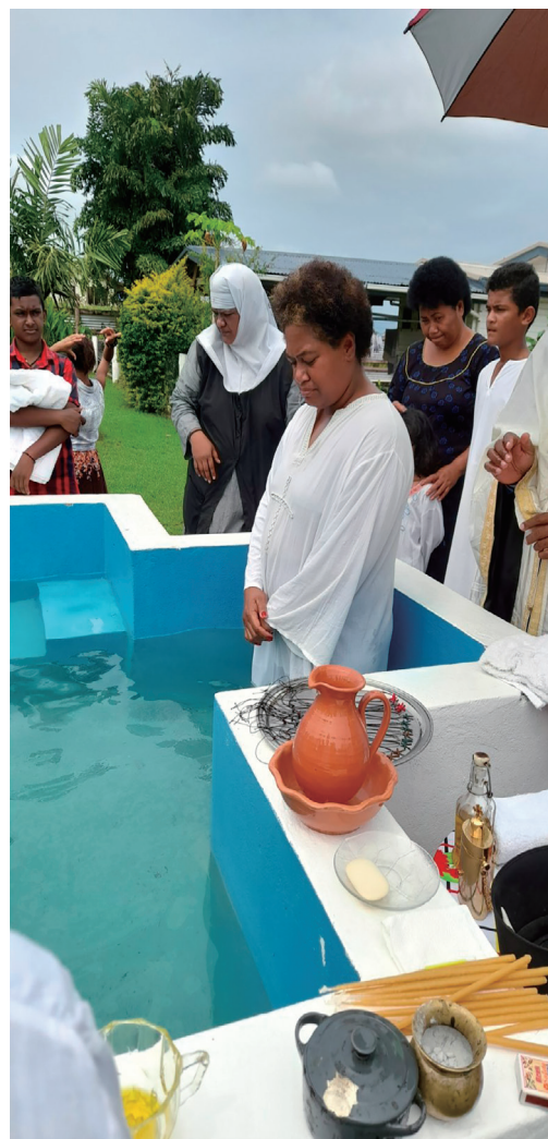
Στιγμές από τη βάπτιση των 12 νεοφώτιστων αδελφών μας

Θα θέλαμε να σας παρακαλέσουμε αγαπητοί μου αδελφοί, να προσεύχεστε για τα