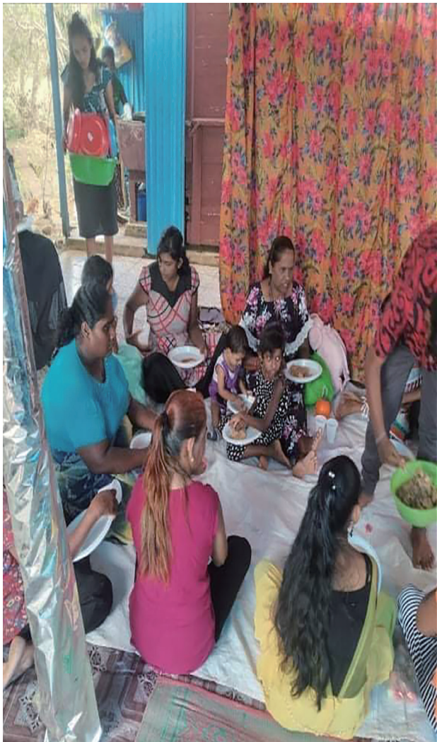
Κοινή τράπεζα μετά την θεία λειτουργία στον άγιο Νικόλαο Labasa Fiji