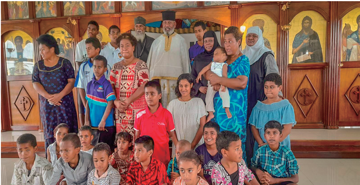
Νεοφώτιστοι, ανάδοχοι, ιερείς και μοναχές μετά την βάφτιση στο Ιερό Ναό της Αγίας Τριάδος, Σαουένι

Viti Levou και στις εγκαταστάσεις του ιεραποστολικού μας κλιμακίου. Αλλά οι υλικές επιπτώσεις στο μικρότερο νησί Vanoua Levou και στον Ιερό Ναό των Αγίων Νικολάου και Αθανασίου ήταν πιο σοβαρές. Πτώσεις δέντρων προκάλεσαν τη μερική ρήξη της σκέπης της οικίας του Ιερέως, την καταστροφή των δύο κοινοχρήστων τουαλετών και την αχρήστευση