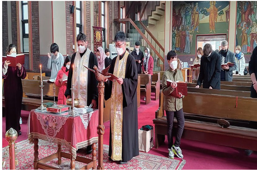
Η τέλεση του Αγιασμού στον Ι. Ν. του Αγίου Νικολάου στην Σεούλ, για την έναρξη του νέου σχολικού και κατηχητικού έτους εν μέσω COVID-19

Θα ήθελα εδώ να κάνουμε μια αναγκαία διευκρίνιση. Μερικοί συγχέουν την ιεραποστολή της Εκκλησίας με τον προσηλυτισμό που ασκούν διάφορες αιρέσεις. Ο προσηλυτισμός είναι αυτό που έκαναν οι Εβραίοι και το οποίο κατεδίκασε ο Κύριος. Το να προσπαθεί, δηλαδή, κάποιος να παραπλανήσει το άλλον με διάφορα πονηρά μέσα για να τον τραβήξει στην παράταξή του. Αυτό το καταδικάζει, όπως είναι φυσικό, και η Ορθόδοξη Εκκλησία, η οποία ποτέ δεν χρησιμοποίησε τέτοια μέσα. Η Ορθόδοξη Ιεραποστολή είναι κάτι το τελείως διαφορετικό. Σέβεται την ελευθερία του κάθε προσώπου. Κηρύσσει την αλήθεια