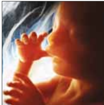
Τό θαύμα τής ζωής! Έμβρυο 20 εβδομάδων.

Τριάντα (30) όλόκληρα χρόνια έχουν παρ-έλθει και τά άποτελέσματα αυτού του άνομου νόμου είναι όρατά και άπειλοϋν δημογραφικά, αλλά, τό σπουδαιότερο, ήθικά και πνευματικά τήν ύπόσταση τής Πατρίδος μας. Έάν ύπολογίσουμε ότι πραγματοποιούνται περίπου 350.000-450.000 Έκτρώσεις έτησίως στή Χώρα μας (σύμφωνα μέ άλλους ύπολογισμούς άνέρχονται στίς 500.000, πού είναι και τό πιο πιθανό) και πολλαπλασιάσουμε μέ τό 30 (έτη), τό άποτέλεσμα τής πράξης είναι σοκαριστικό: 10,5 μέ 13,5 έκατομμύρια άθώα έμβρυα έχουν δολοφονηθεί. Πάνω από μία όλόκληρη Ελλάδα έχει «φονευθεί»! Και ή έμβρυοκτονία συνεχίζεται...!