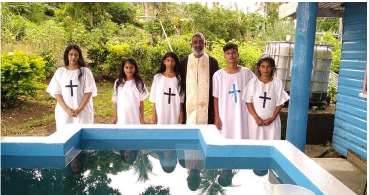
Οι 5 νεοφώτιστοι στην Ενορία του Αγίου Αθανασίου με τον π. Βαρνάβα.