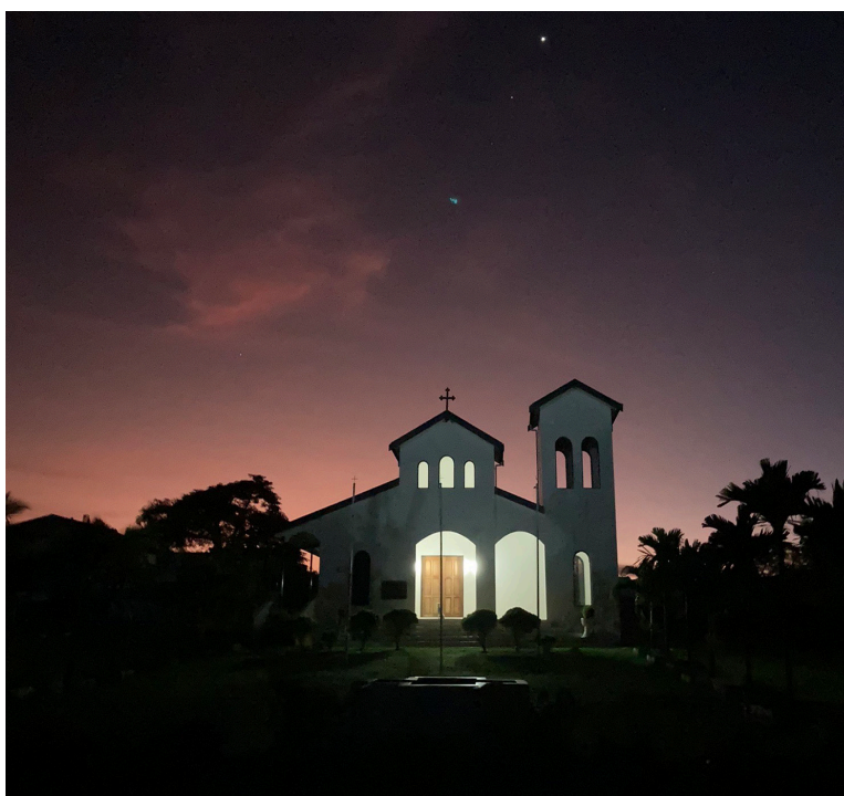
Ὁ ἱερός Ναός της Αγίας Τριάδος στο Νάντι