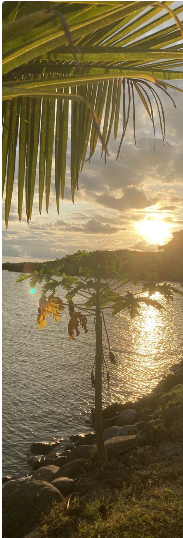
Ανατολή στα Φίτζι