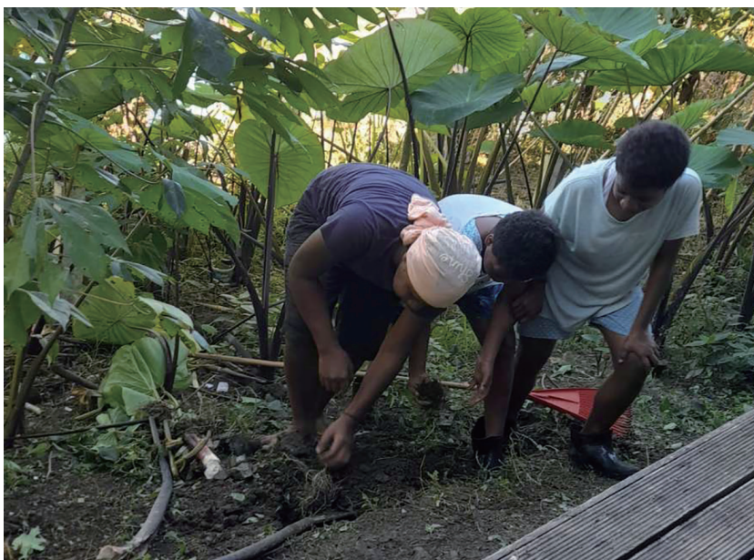
Μαθαίνοντας την καλλιέργεια του κήπου

Η υγειονομική κατάσταση στα νησιά Φίτζι μέρα με τη μέρα επιδεινώνεται και γίνεται ολοένα και πιο επικίνδυνη για τους κατοίκους των νησιών. Η αύξηση των κρουσμάτων ακολουθεί εκθετική πορεία. Οι υγειονομικές υποδομές των νησιών έχουν πολλά προβλήματα και τεράστιες ελλείψεις. Για εμβολιασμό φυσικά ούτε λόγος.