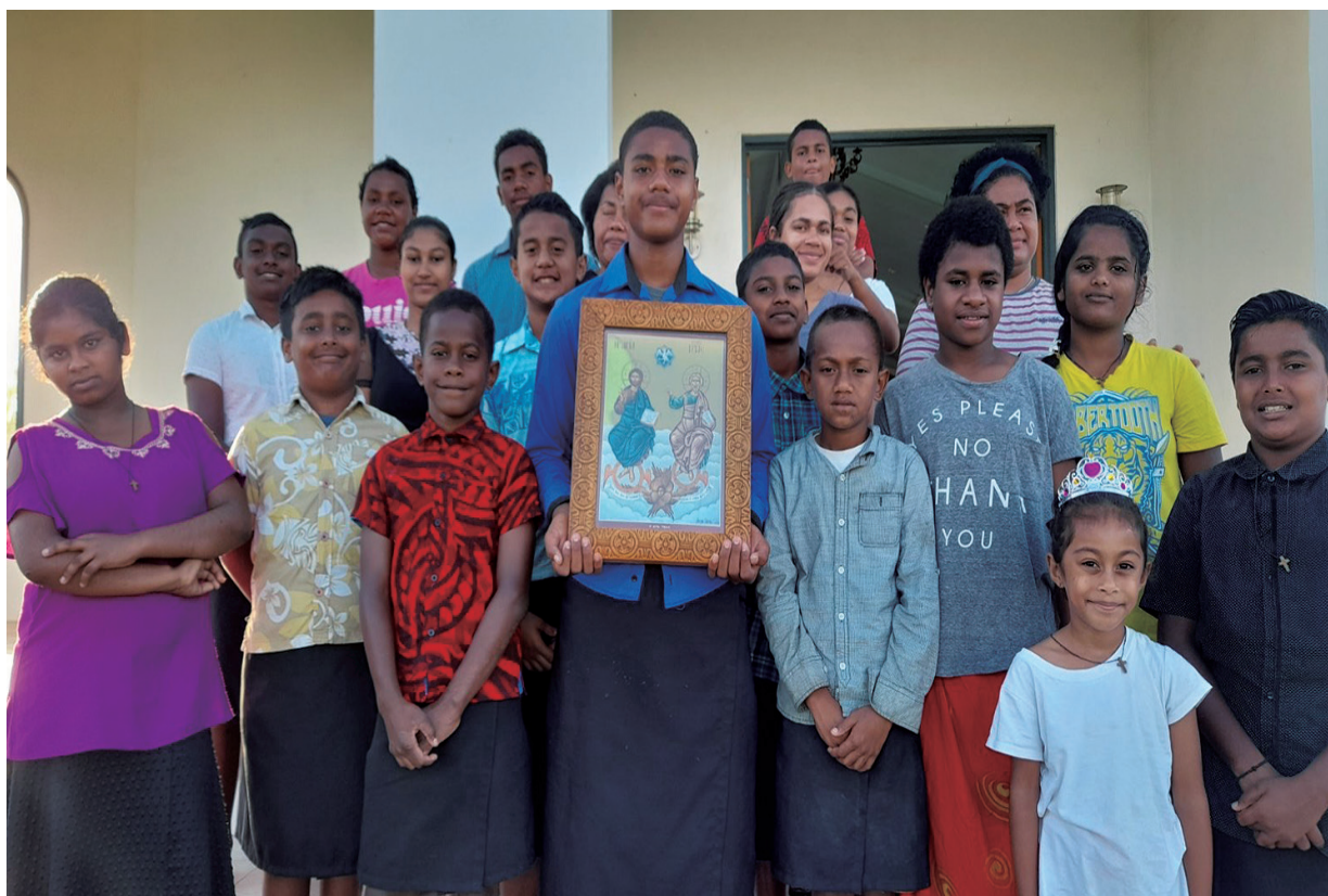
Τα παιδιά του ορφανοτροφείου την Κυριακή της Πεντηκοστής έξω από τον Ναό της Αγίας Τριάδος