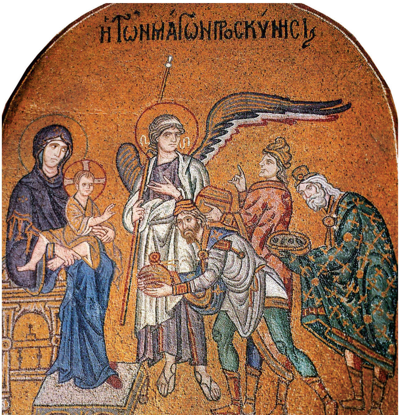
Η προσκύνηση των Μάγων στο ψηφιδωτό διάκοσμο του ναού του Αγίου Απολλιναρίου του Νέου, στη Ραβέννα. Χρονολογείται περίπου στα 561.

Οδοῦ επέστρεψαν στη Μηδία. Με αυτόν τον τρόπο μάλλον υπαινίσσεται την αφή του ιλαρού Φωτός στην πατρίδα τους. Σημειωτέον ότι τα Εκβάτανα (ελλην. Επιφάνεια , σημ. Χαμαντάν Ιράν), στον οδικό άξονα από τη Μεσόγειο προς την Κίνα και την Κορέα, εντοπίζονταν στη δαιμονική για τους Ρωμαίους περιοχή των Πάρθων. Εκεί, όμως, (α) σπούδασε το 600 π. Χ. ο Πυθαγόρας, (β) διέδωσε τη φιλοσοφία του περί της μάχης του καλού και του κακού ο