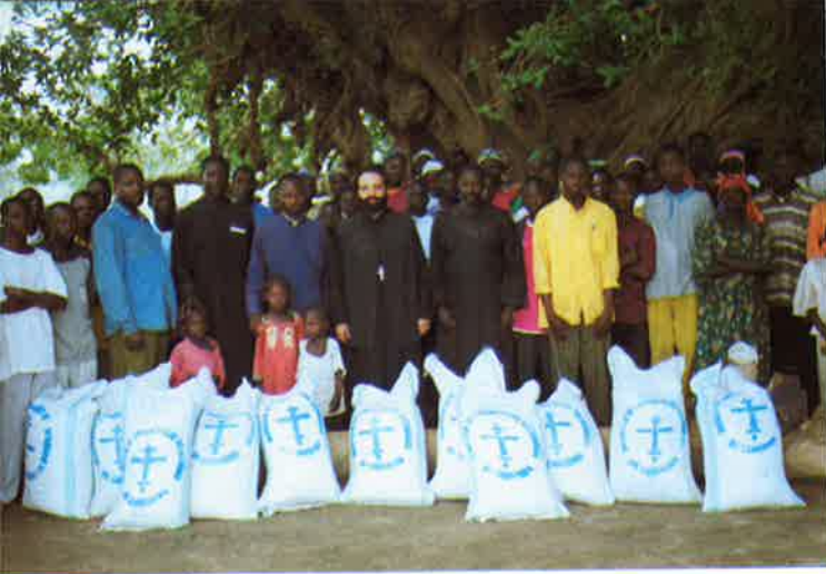
Ένορία 'Αγ. Ειρήνης Tchatiballi (26-8-2005).