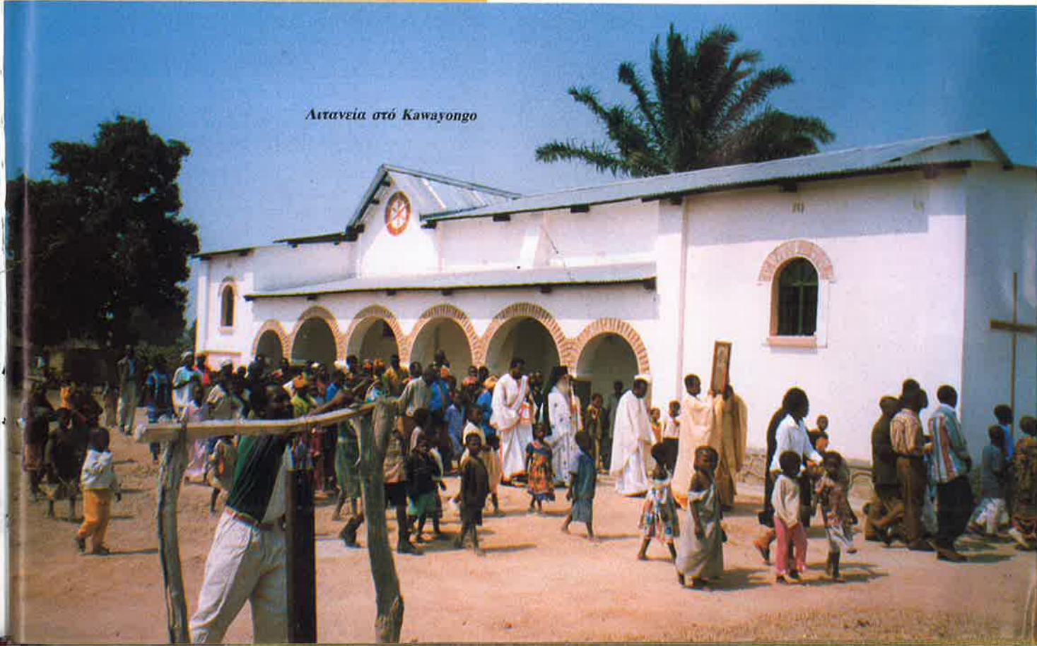
Αιτανεία στό Kawayongo