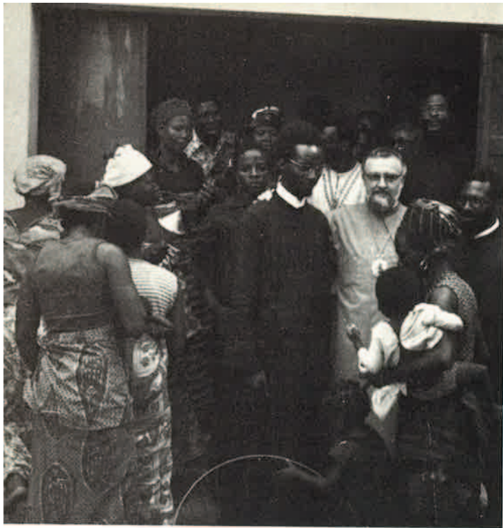
-Ο Σεβ. Μητροπολίτης Κεντρώας Ἀφρικής κ. Τιμόθεος ἀνάμεσα σούς ἰθαγενεῖς κληρικούς τῆς Κανάνγκα.