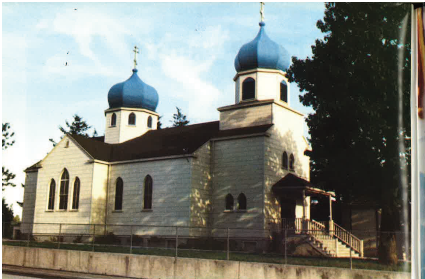
Ὁ Ναός τῆς «Ἐνδόξου Ἀναστάσεως» στό Κόντιακ τῆς Ἀλάσκα.