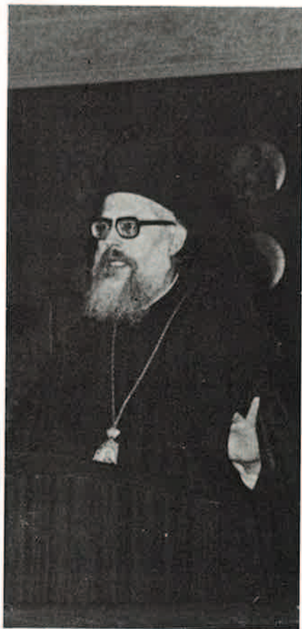
Εισήγησης υπό του Θεοφ. Ἐπισκόπου Ἀνδρούσης κ. ΑΝΑΣΤΑΣΙΟΥ, καθηγητοῦ Πανεπιστημίου Ἀθηνῶν στό Θεολογικό Συνέδριο Πατρῶν 26-11-1978