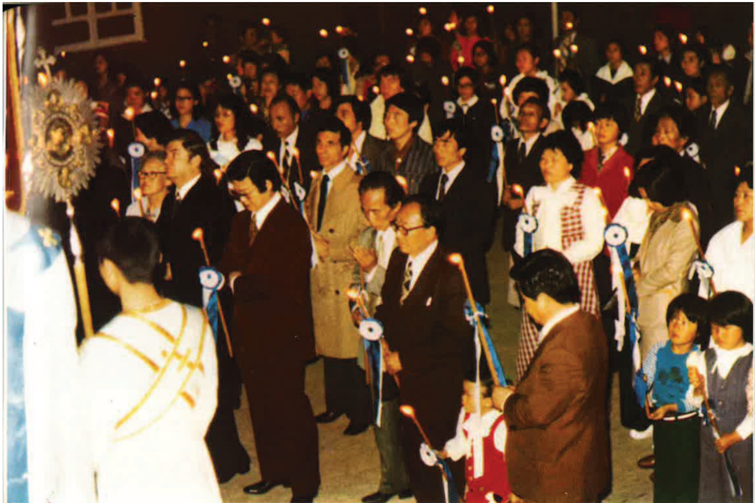
Άπό τήν ἀκολουθία τῆς Ἀναστάσεως, στό προαύλιο τοῦ Ἱ. Ναοῦ τοῦ Ἁγίου Νικολάου στή Σεούλ.