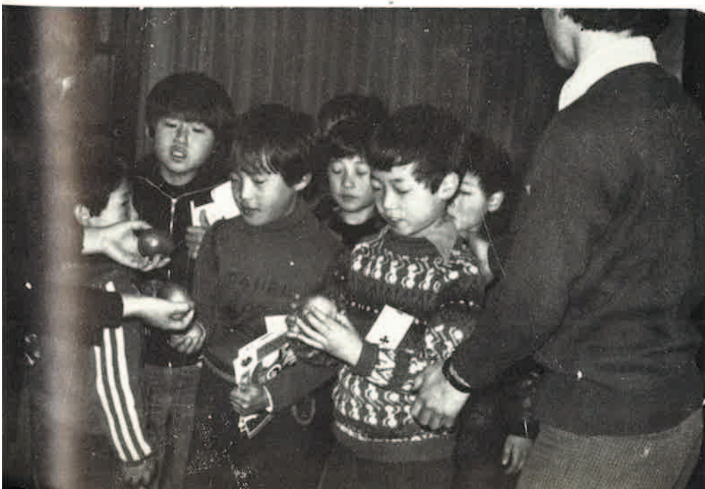
Σ' ἕνα διάλειμμα τοῦ προγράμματος τοῦ «Κατηχητικοῦ Τριημέρου» προσφέρονται μήλα στά μικρά Κορεατόπουλα, πού τό παρακολουθοῦν.