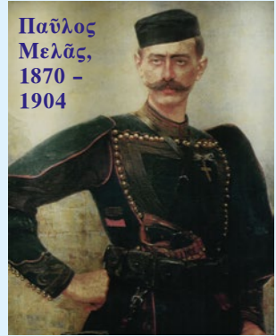
Παῦλος Μελάς, 1870 - 1904