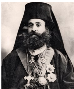
Μητροπολίτης Γερμανός Καραβαγγέλης, 1866 - 1935

του Ἑλληνικοῦ στρατοῦ ἐπέδειξαν ἡγετικές καὶ ὀργανωτικές ἱκανότητες καί, συνάμα, ἀπέκτησαν ἐμπειρίες καὶ γνώσεις στὸ χῶρο τῆς Μακεδονίας, οἱ ὁποῖες θὰ ἐξαργυρωθοῦν ἀργότερα μὲ τοὺς Βαλκανικοὺς Πολέμους. Παράλληλα, ἀνέκτησαν τὸ σεβασμὸ καὶ τὴν ἐμπιστοσύνη τοῦ Ἑλληνικοῦ Λαοῦ, ἀνυψώνοντας τὸ πολεμικὸ φρόνημά του, πού εἶχε καταθρακῶσει ὁ πόλεμος τοῦ 1897.